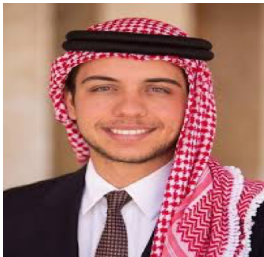
حضرة صاحب السمو الامير الحسين بن عبد الله الثاني ولي العهد