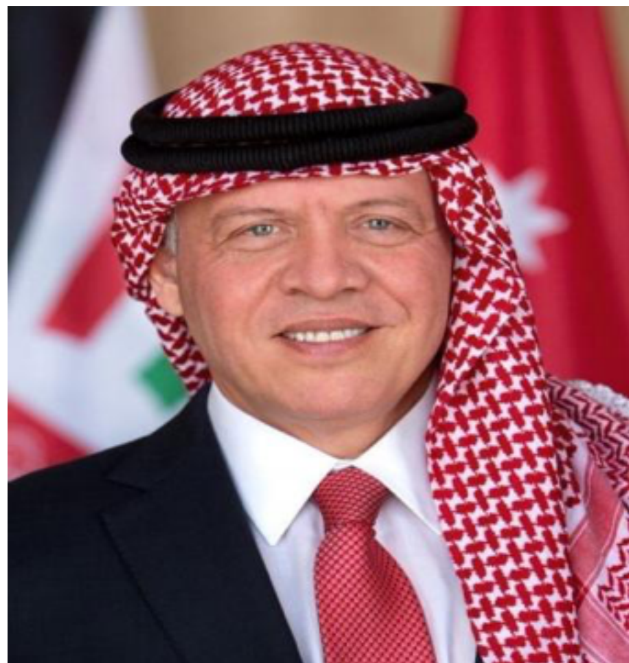
حضرة صاحب الجلالة الملك عبد الله الثاني ابن الحسين المعظم